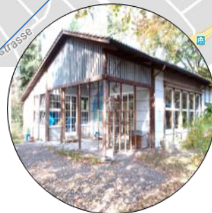
KG Wyssloch I & II