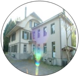
KG Laubeggstr. 23